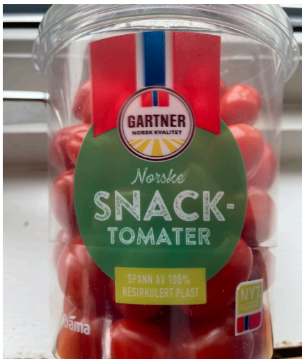
«Bøtta» ble mye omtalt på møtet.